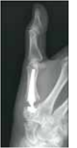
De prothese is duidelijk zichtbaar op het radiologisch beeld.

X Vaak is de beste optie het gewricht wegnemen en vervangen door een duimbasisprothese . Er zijn wel een aantal voorwaarden: er wordt nadien alleen fijn werk van de handen verwacht, het bot moet stevig genoeg zijn en de omliggende gewrichten moeten goed gezond zijn. In dat geval kunnen we onder lokale of algemene verdoving een prothese plaatsen. Dit gebeurt tijdens een korte opname in het ziekenhuis.