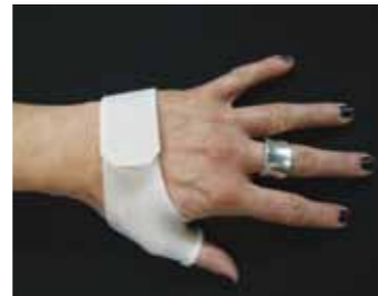
een duimspalk of 'vlinderspalk'

X Zeker wanneer de pijnklachten niet al te erg zijn, proberen we zonder ingreep de pijn te verbeteren. Hiervoor kunnen we een spalk aanleggen, tijdelijk pijnmedicatie voorschrijven of een cortisonespuit plaatsen.