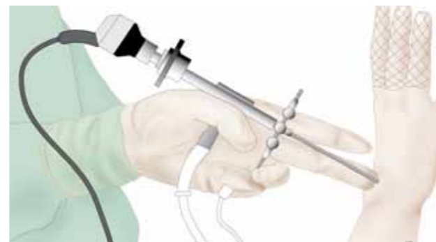
polstartroscopie met wegnamen van de cyste