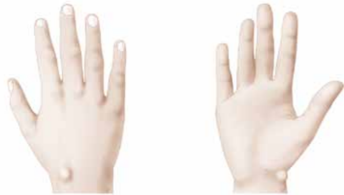
de twee klassieke plaatsen van een polscyste

Een polscyste is een zwelling aan de pols, veroorzaakt door een vochtblaasje in het polsgewricht. Hierdoor is een zwelling te voelen of te zien en deze zwelling kan soms pijnlijk zijn. De twee klassieke plaatsen zijn op de rug van de pols en aan de duimzijde van de palm van de pols.