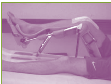
Kinetec van knie

Het is normaal dat uw knie na de operatie warm aanvoelt en zwelt. Om de zwelling te verminderen moet het geopereerde been hoger liggen. Dit kan door het voeteneinde van het bed in hoogstand te zetten. Zorg ervoor dat er altijd een kussentje onder uw hielen ligt zodat uw knie volledig gestrekt blijft. Tweemaal per dag wordt na de oefeningen ijs op de knie gelegd gedurende 30 tot 45 minuten. Dit helpt om de pijn en de zwelling te verminderen.